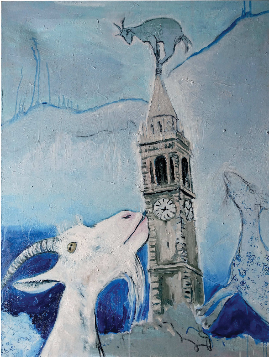
Verliebte Ziege | Goat fallen in love

Öl auf Leinwand | Oil on canvas | 100 x 75 cm | 2018