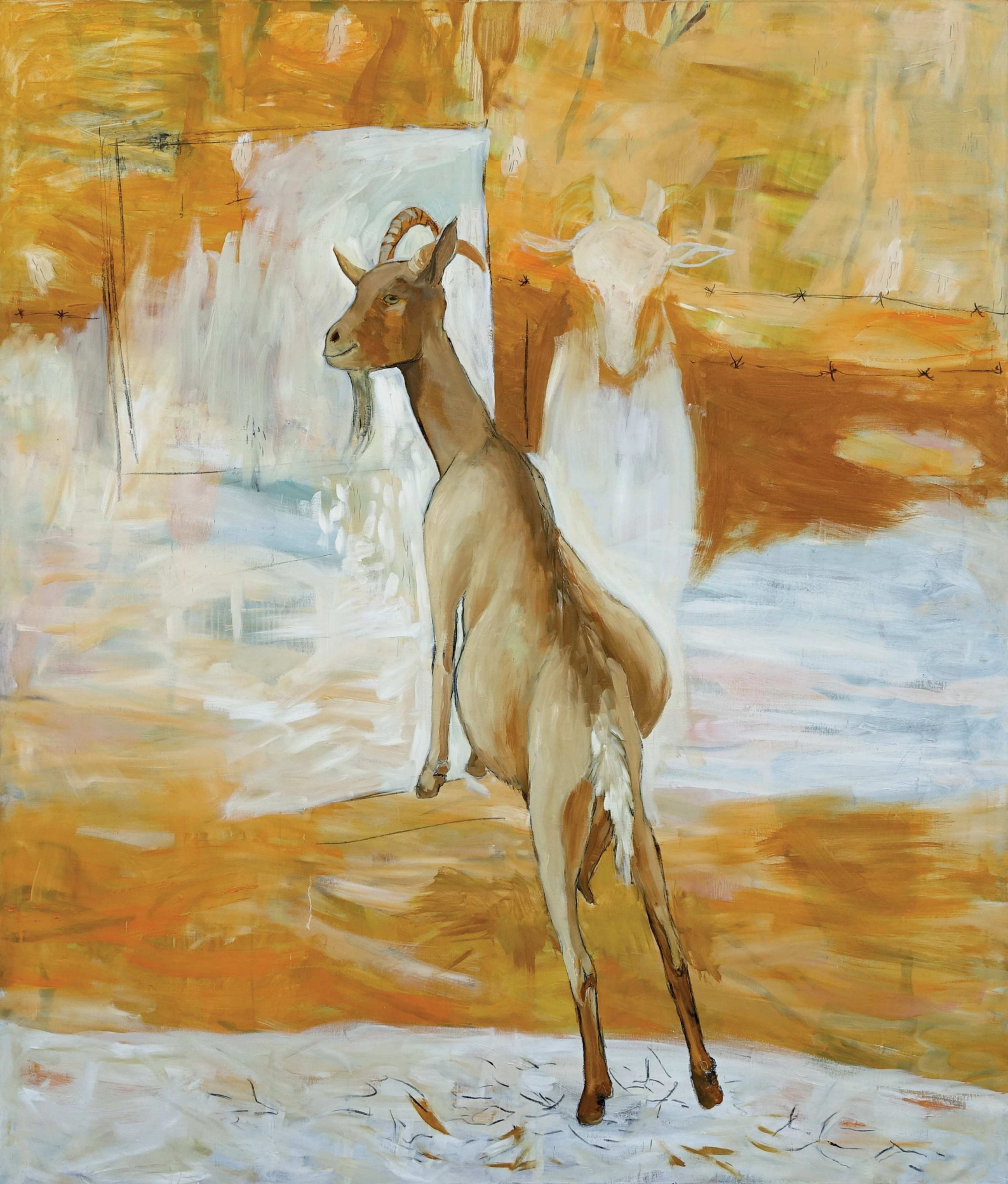
Auf der Suche nach Arkadien (Licht) | Searching for Arcadia (Light)

Öl auf Leinwand | Oil on canvas | 200 x 170 cm | 2018