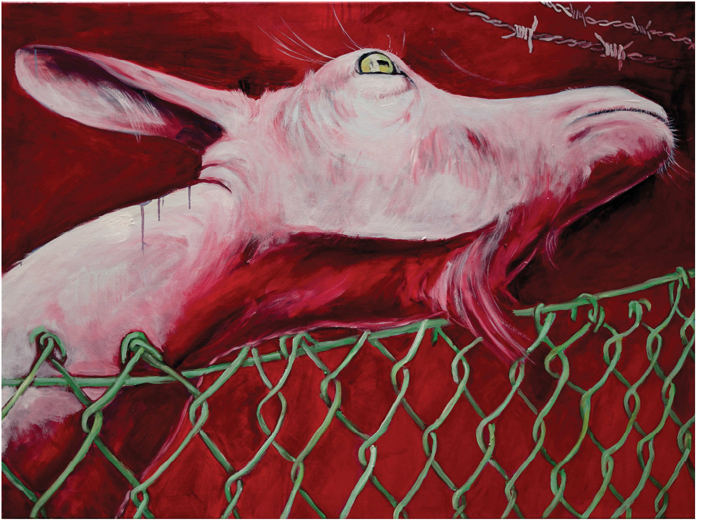
Bauliche Maßnahme | Construction Measure

Öl auf Leinwand | Oil on canvas | ca.90 x 110 cm | 2019