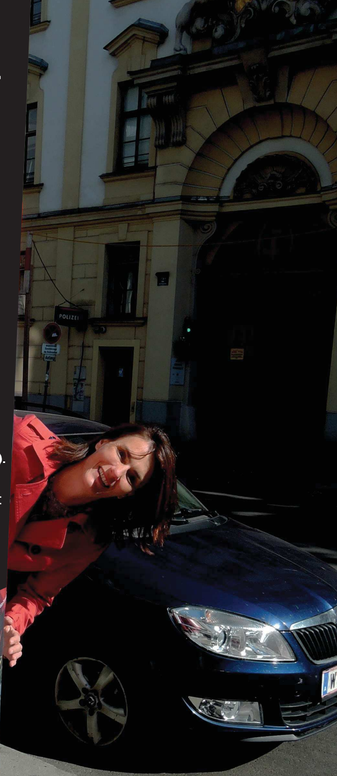
Plakat des Galerienrundganges in Wien 3 September 2019