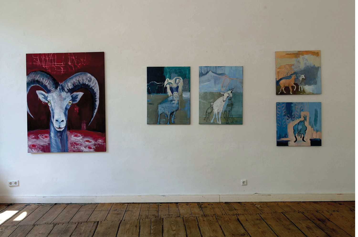
Ausstellungsansicht | Exhibition View - K-Salon, Berlin Mai | May 2018