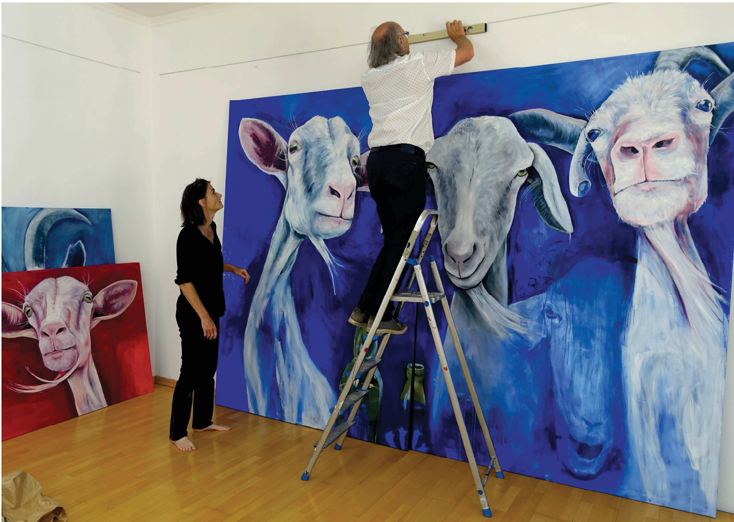
Ausstellungsansicht, Hängung | Exhibition View, Installing "...blüht der Enzian" Museum Moderner Kunst Niederösterreichs | NOEDOK Juni - September | June - September 2019